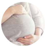
出生時就患有先天性白內障