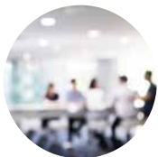
視力模糊、視力下降