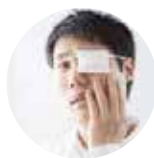
眼睛曾經受過外傷