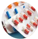
使用某些藥物如類固醇