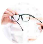
若須經常更換眼鏡/隱形眼鏡度數亦可能是白內障的先兆